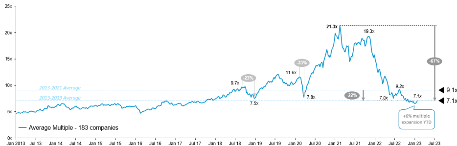
Average LTM Rev. multiples – SWC 183 Companies Index

Note : Données en date du 26/01/2023, date de clôture du marché.