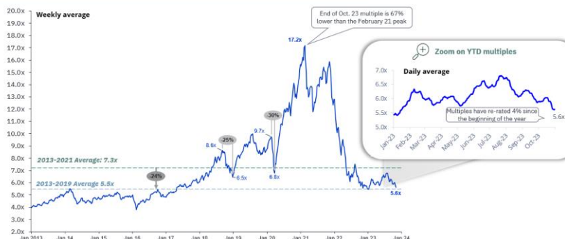
SWC Index (1) NTM Rev. multiples

Note : Données en date du 30/10/2023, date de clôture du marché.